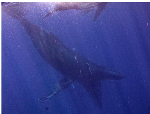
La baleine surnommée Karima est affaiblie et ne doit plus être approchée.

Ces préconisations sont affichées, dites et redites par le Parc naturel marin de Mayotte chaque année lors de grandes campagnes de communication autour de la charte d'approche respectueuse des mammifères marins, et ce depuis 2014. Il est grand temps d'en tenir compte !