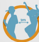
Danse en distanciation